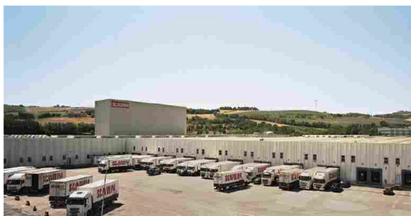
Scavolini, i headquarter Montelabbate.